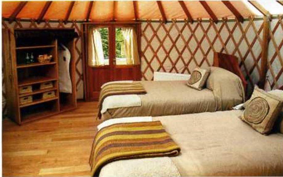
Los yurts por dentro: 27 metros cuadrados de puro placer.